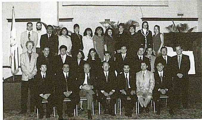
Colaboradores de CIEN, agosto 1999.

Mucha de la mística de nuestra institución y de la pasión de nuestros estudios están relacionadas con el amor a los guatemaltecos. Existe entre nosotros una convicción profunda de que el país puede mejorar.